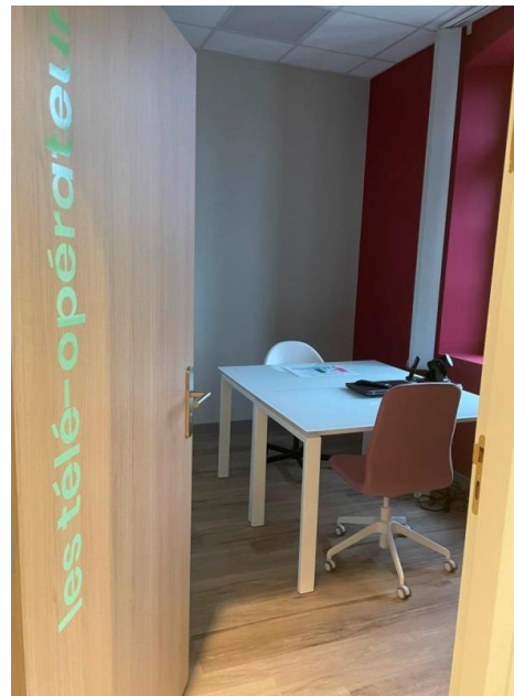
« Les télé-opérateurs »